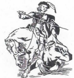
Comité Sintemetten Belle