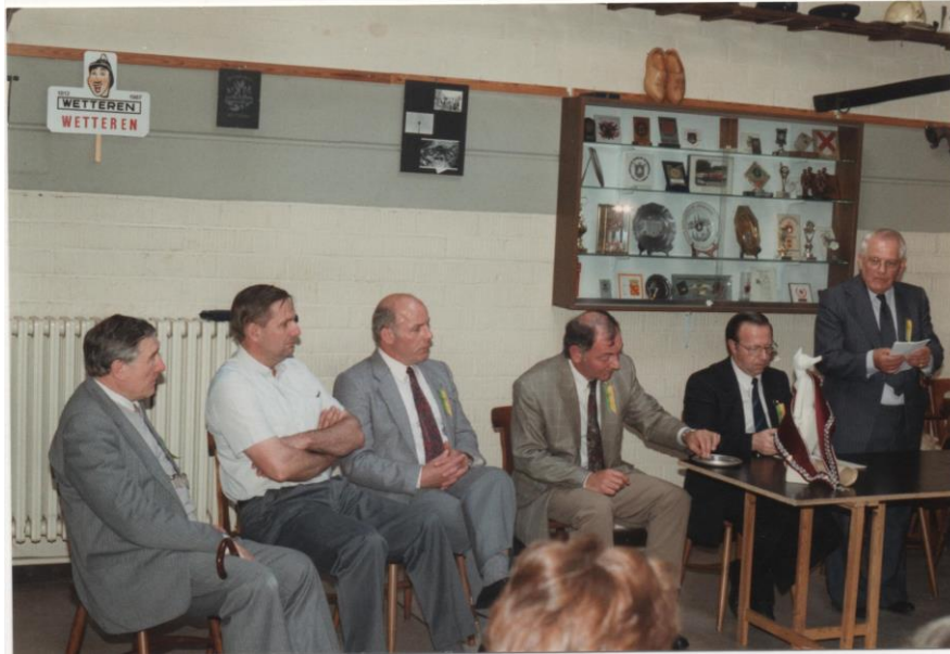
Slotzitting van de goudtag te Wetteren (1990).