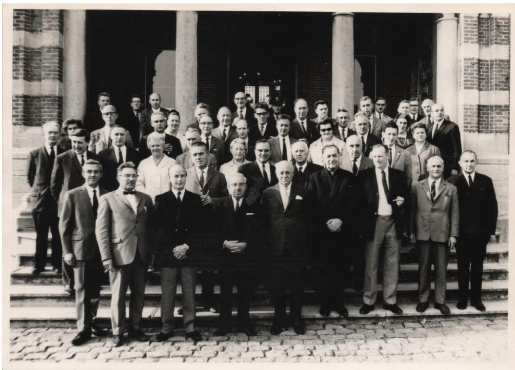
Gouwdag te Mariakerke – 1969