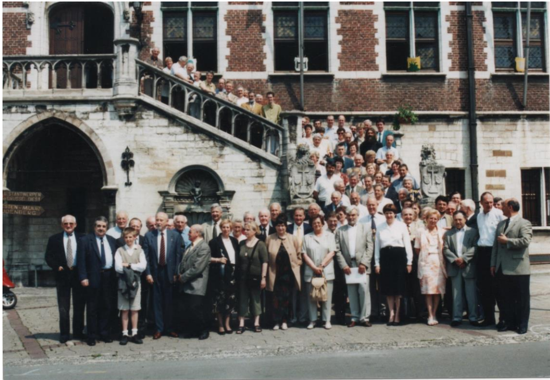
Gouwdag te Geraardsbergen (2000)