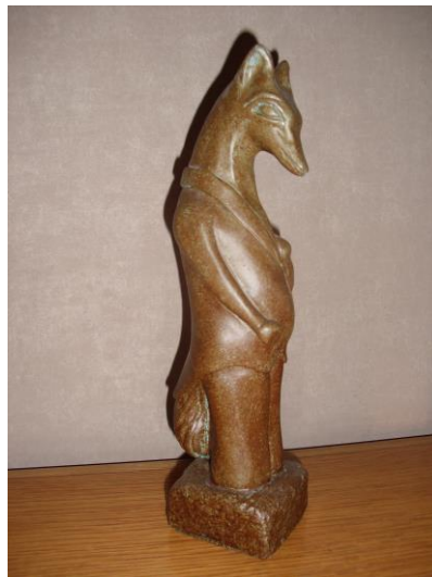
Reinaertbeeld van André Boeykens (2009)