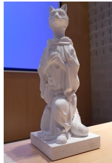
Reinaertbeeld van Paul Dekker (vanaf 2014)